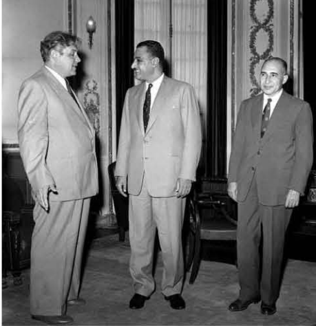
الرئيس جمال عبد الناصر يستقبل شيبيلوف وزير الخارجية الاتحاد السوفيتي بحضور محمود فوزي وزير الخارجية ١٩٥٦/٦/١٧

الشعب يتكلم عن احتمال تحية ايدن؛ كمنذ عن السياسة الفاشلة في الشرق الأوسط.